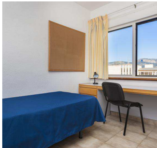
▲ Algunas habitaciones tienen vistas a la Serra de Tramuntana.

La Residencia ofrece la habitación con desayuno incluido, salas comunes, abono para CampusEsport, calefacción y wifi. En los últimos años tiene una gran demanda